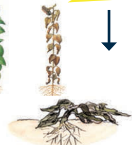
Fig. 9: Sonneblom groeistadiums